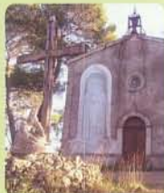
Chapelle Noire-Dame du Glaive