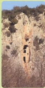
Trois des fées