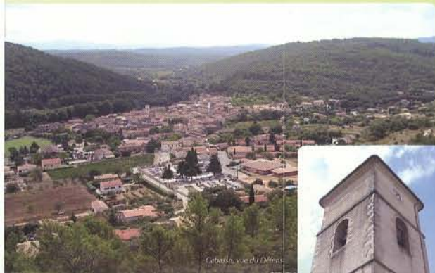
Cabasse, vue du Collège