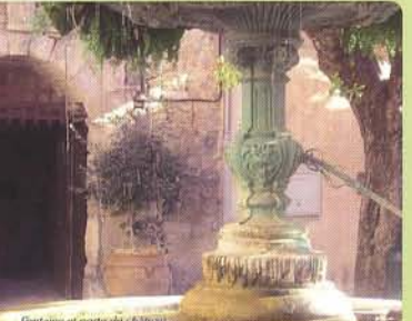
Fontaine et porte du Château

CABASSE : petit bourg de la vallée de l'Issole. Village du centre Var. 1700 habitants. Altitude 200 mètres avec une superficie de 4549 hectares. Le village se situe sur l'axe TOULON - RIEZ départementale D 13 et l'axe BRIGNOLES - LE LUC, départementale D 79 et 33. Desservi par l'autoroute A8 sortie Brignoles ou Le Luc, à 12 kilomètres.