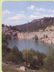
Lac des mines